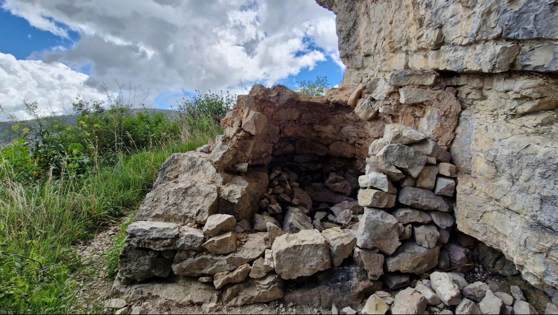
Le four à pain