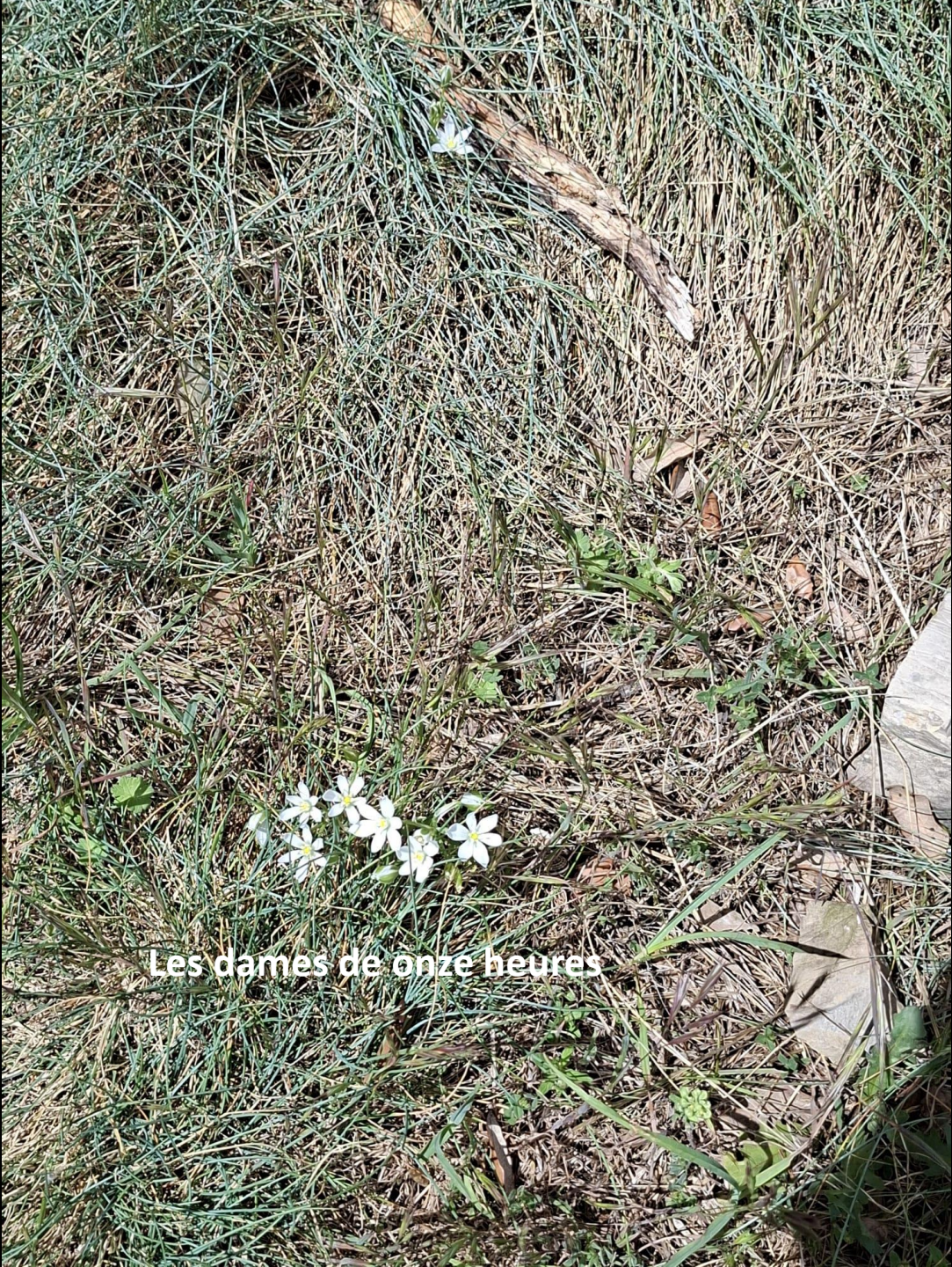
Les dames de onze heures