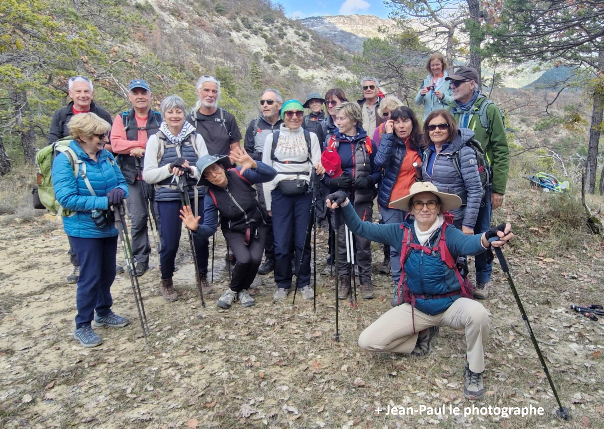
+ Jean-Paul le photographe