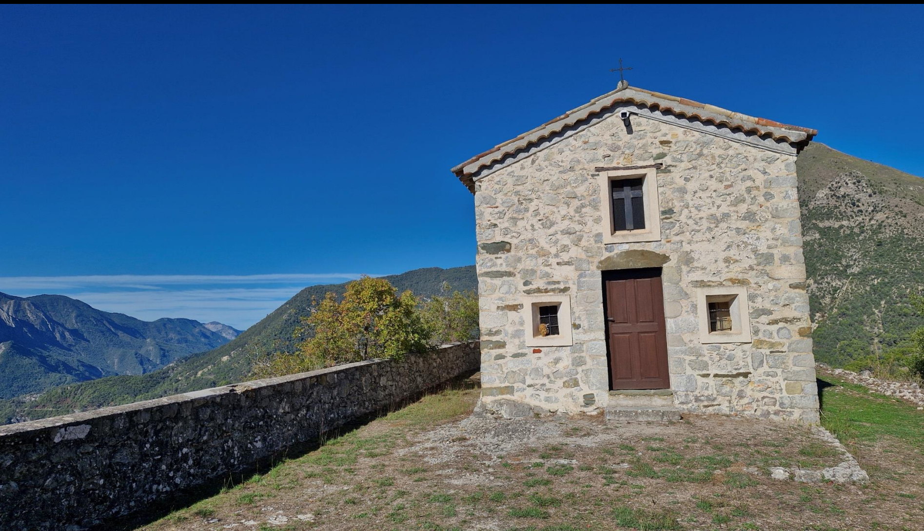
La chapelle du vieux village de Tournefort