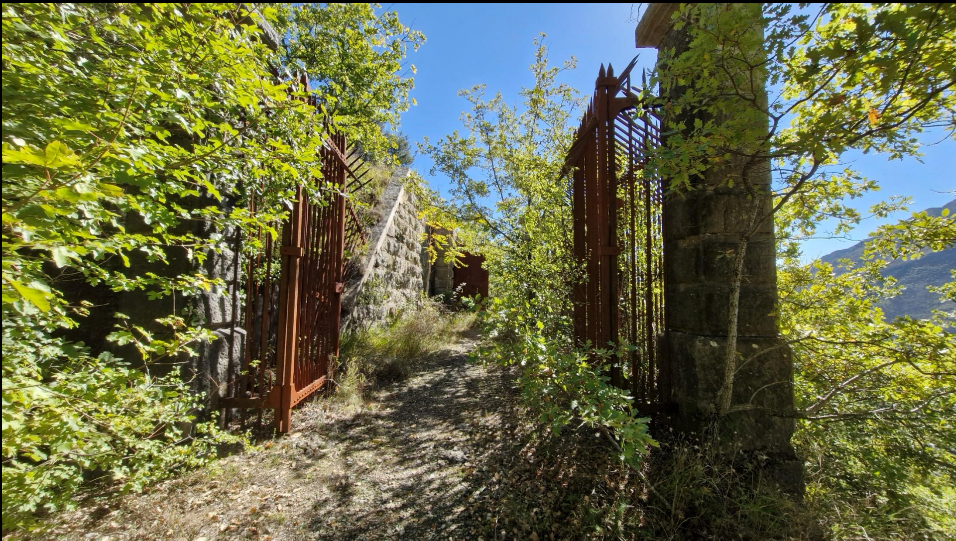
L'entrée du fort du pic Charvet