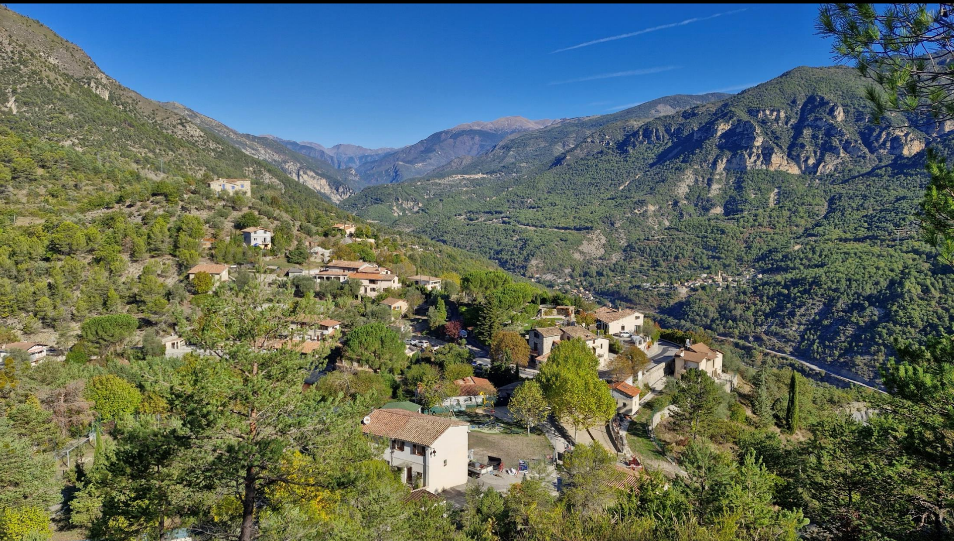
Le village de Tournefort