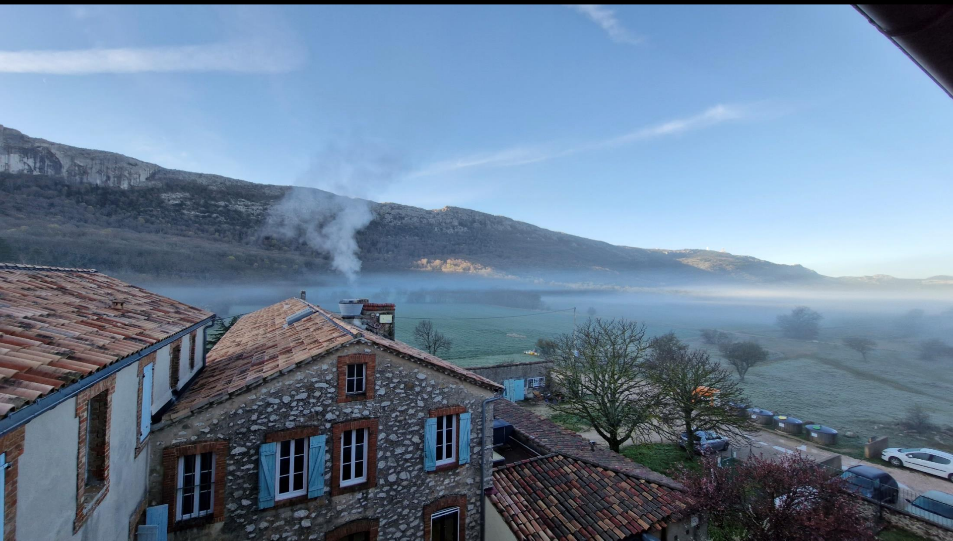
L'hôtellerie de la Sainte Baume au petit matin.