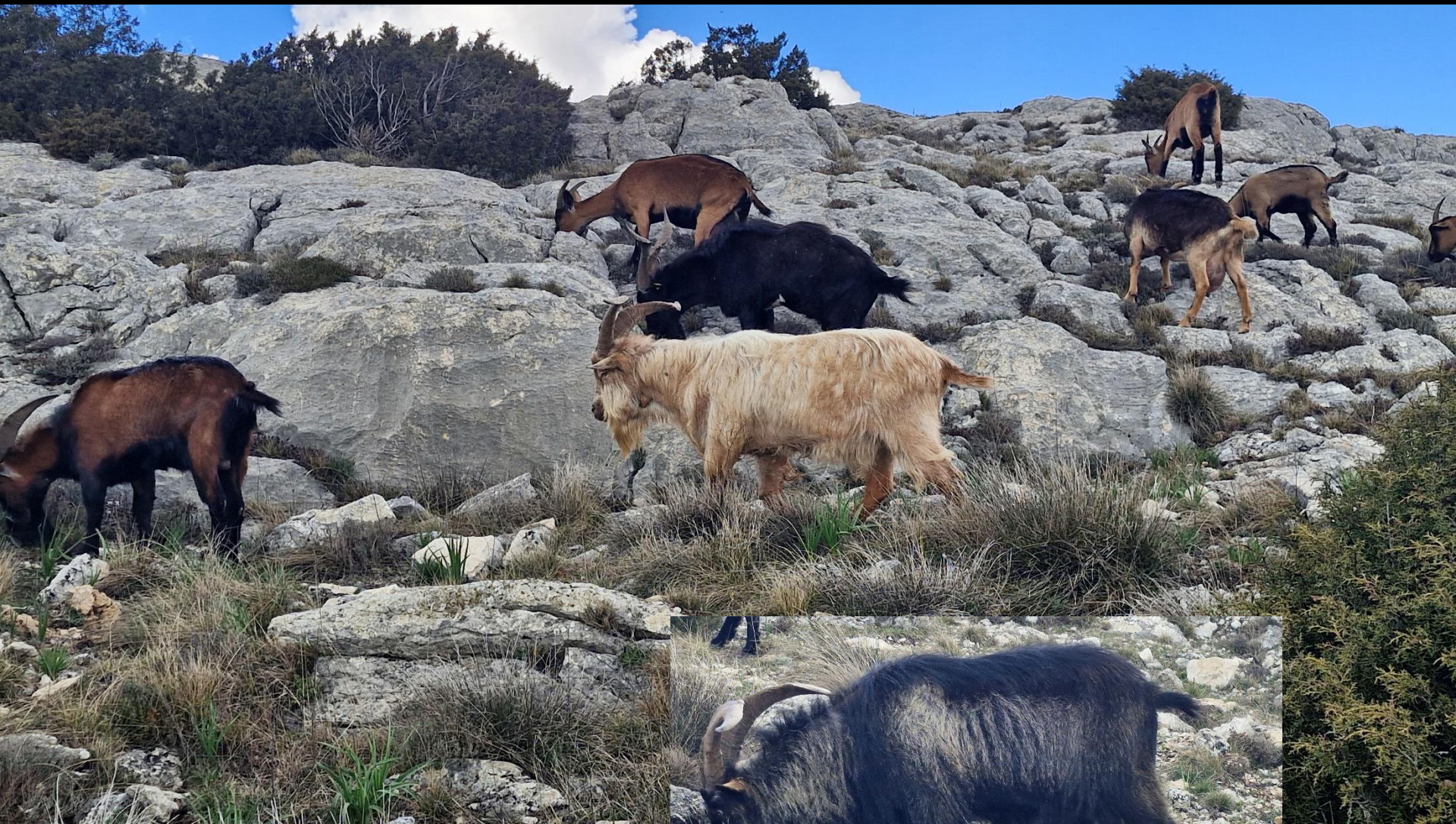
Les chèvres du Rove