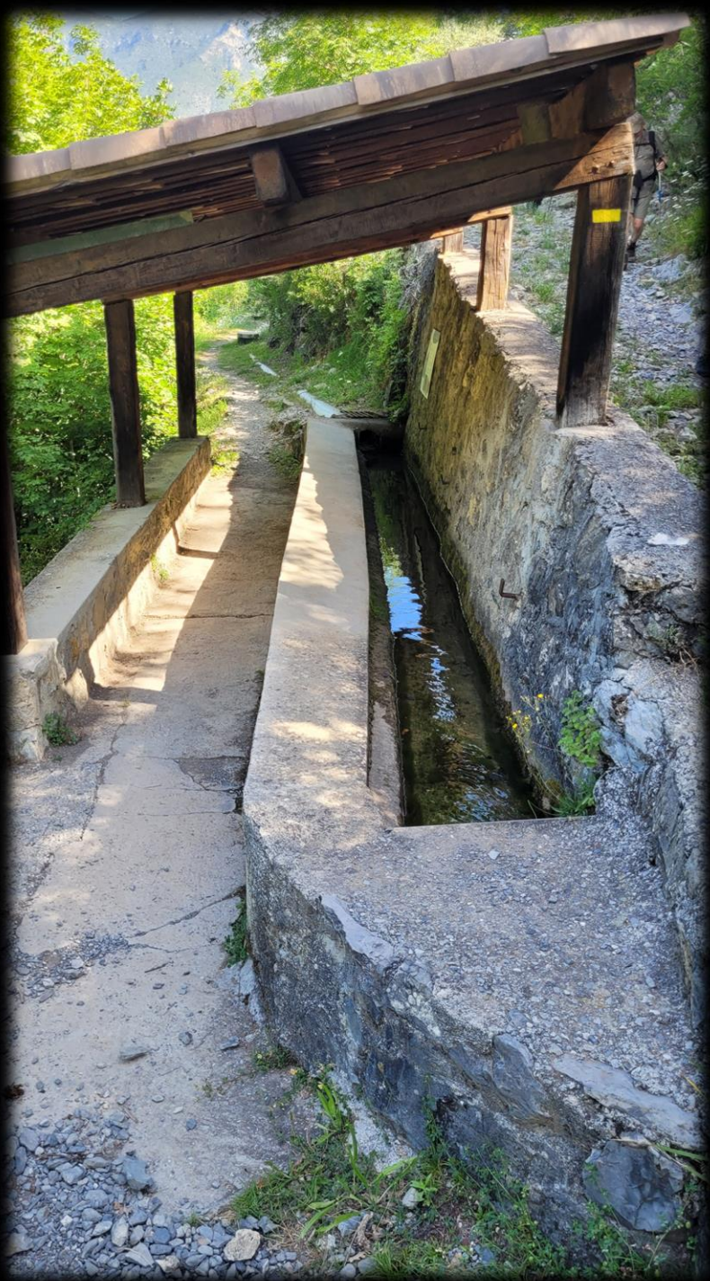
Le lavoir de Malaussène