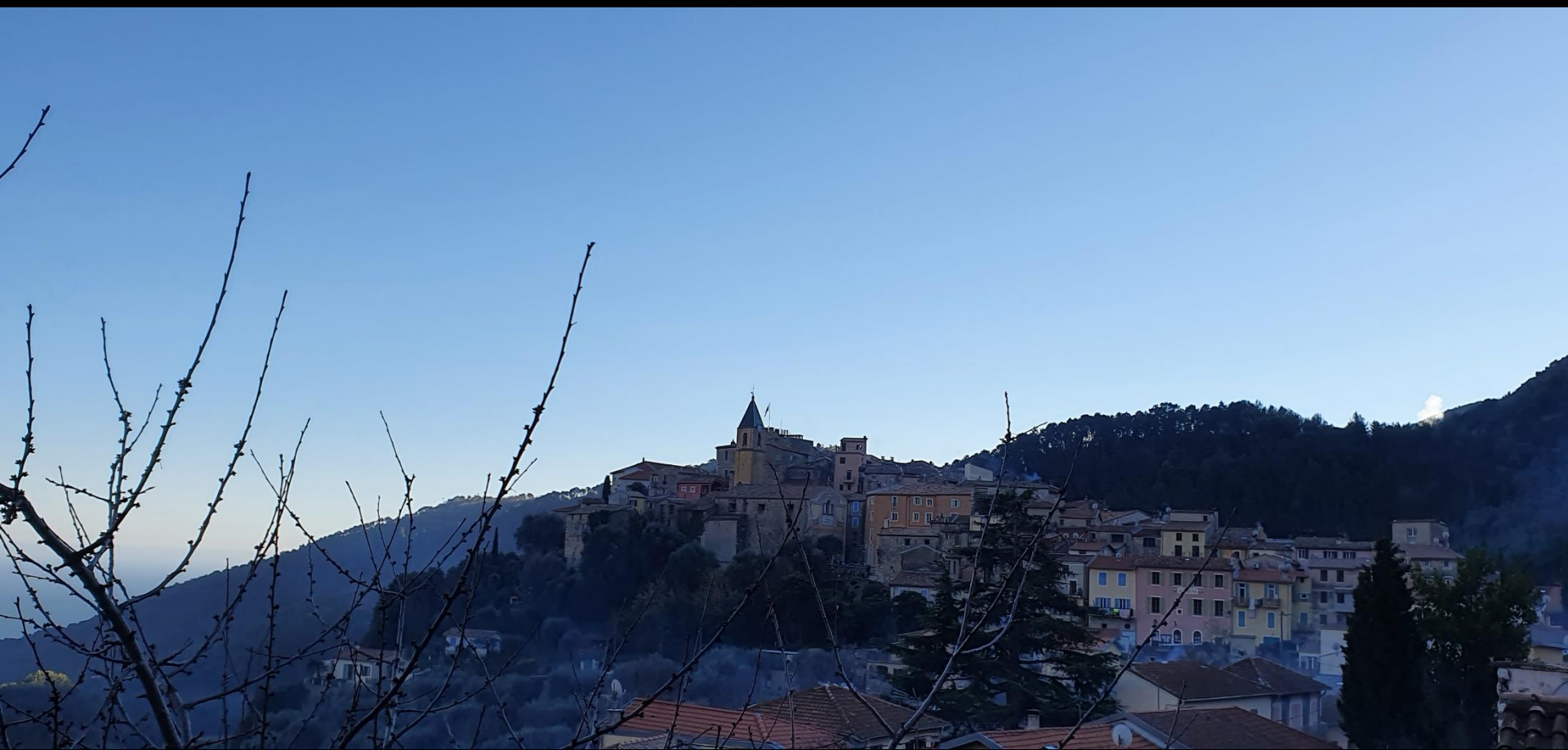
Gorbio et son château Lascaris.