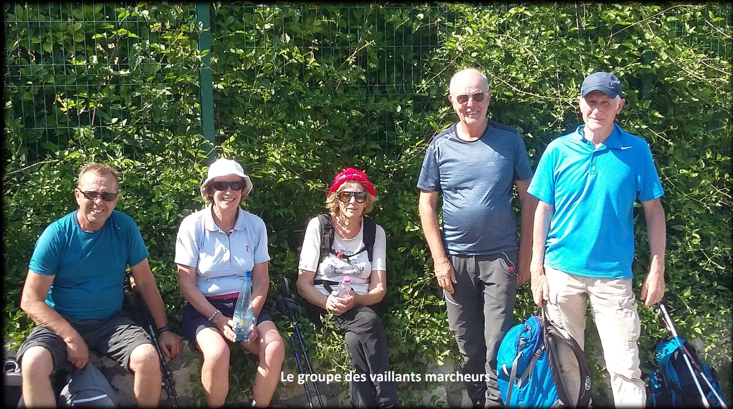
Le groupe des vaillants marcheurs