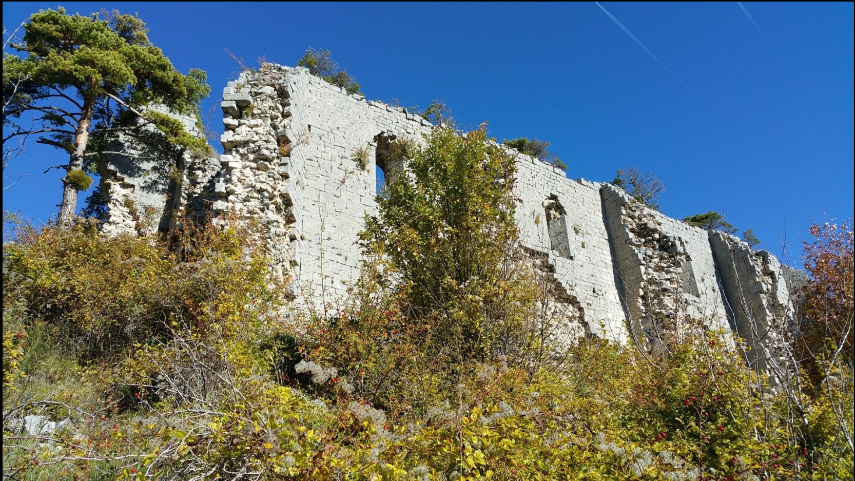
Les ruines du vieux Séranon