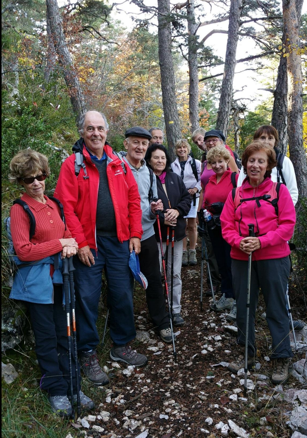
L'équipe du jour.